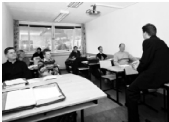
Abbildung 2: Der Unterricht im WS 2001/2002 an der Privaten Universität für Medizinische Informatik und Technik Tirol

»Die Zeichen der Zeit erkennen«, so steht es in der Informationsbroschüre der UMIT [7]. Gute Medizin erfordert gute Information! Wir wünschen uns, dass auch UMIT