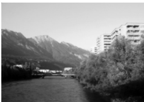
Abbildung 3: Das Ausbildungszentrum West für Gesundheitsberufe (hinteres Gebäude rechts), in dem die Private Universität für Medizinische Informatik und Technik Tirol derzeit beheimatet ist

dazu beitragen kann, dass durch den Fortschritt bei der systematischen Verarbeitung von Daten, Informationen und Wissen sowie durch den Fortschritt bei der Informations- und Kommunikationstechnik die Medizin und die Gesundheitsversorgung weiter verbessert werden: dass sie dazu beiträgt, dass möglichst viele Menschen sich möglichst viel dieser Versorgung werden leisten können, und dass der technische Fortschritt dem Menschen dient und nicht umgekehrt.